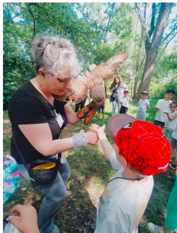
Uscita all'Oasi di Cervara

Ogni anno proponiamo ai bambini diverse uscite didattiche, in linea con la programmazione, in modo che possano vivere nuove esperienze fuori dalle mura scolastiche!